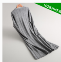
Платье детское Размер: 34-46