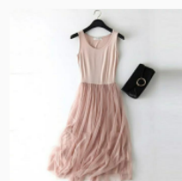
Платье детское Размер: 34-46