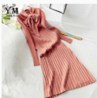
Платье детское Размер: 34-46