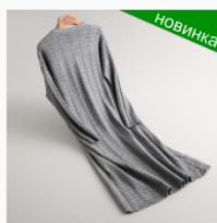
Платье детское Размер: 34-46