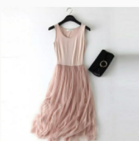
Платье детское Размер: 34-46