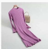
Платье детское Размер: 34-46