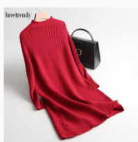
Ботинки зимние Размер: 34-46